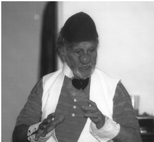
Clown-Workshop am Ernst-Kiphard-Berufskolleg, Dortmund