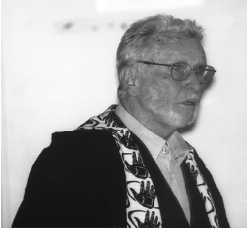
Besuch am Ernst-Kiphard-Berufskolleg, Dortmund