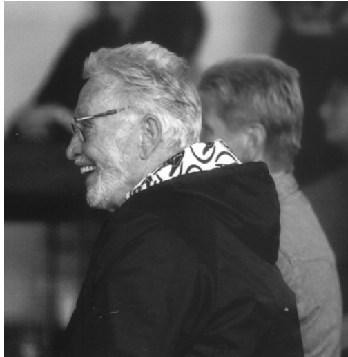
Besuch am Ernst-Kiphard-Berufskolleg, Dortmund